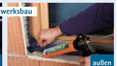
4 Band umlaufend in Leibung verkleben

Fenster in Leibung einbauen, anschließend auf der Leibung ca. 5 mm breite Kleberaube vom Anschlusskleber ORCON F oder ORCON CLASSIC im engen Zickzack umlaufend auftragen und Band luft- bzw. winddicht in den Kleber legen. Auf luft- bzw. winddichte Ausbildung der Ecken achten.