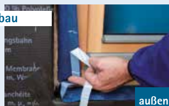
4 Band umlaufend in Leibung verkleben

Fenster in Leibung einbauen, anschließend Trennfolie vom CONTEGA IQ lösen und Band umlaufend in der Leibung luft- bzw. winddicht verkleben. Band fest anreiben. Auf luft- bzw. winddichte Ausbildung der Ecken achten.