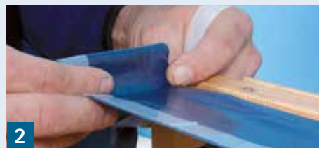
2 Ecken ausbilden

Vor dem Einbau des Fensters CONTEGA IQ seitlich am Blendrahmen mit der unbedruckten Seite zur Leibung hin verkleben. Band fest anreiben.