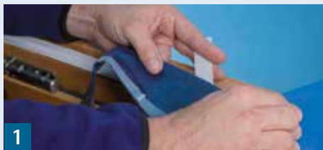
1 Band auf Blendrahmen verkleben

Vor dem Einbau des Fensters CONTEGA IQ seitlich am Blendrahmen mit der unbedruckten Seite zur Leibung hin verkleben. Band fest anreiben.