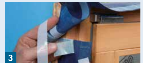
3 Enden verkleben

Damit das Band später einfach und sicher in der Fensterleibung verklebt werden kann, Eckfalten wie hier gezeigt herstellen.